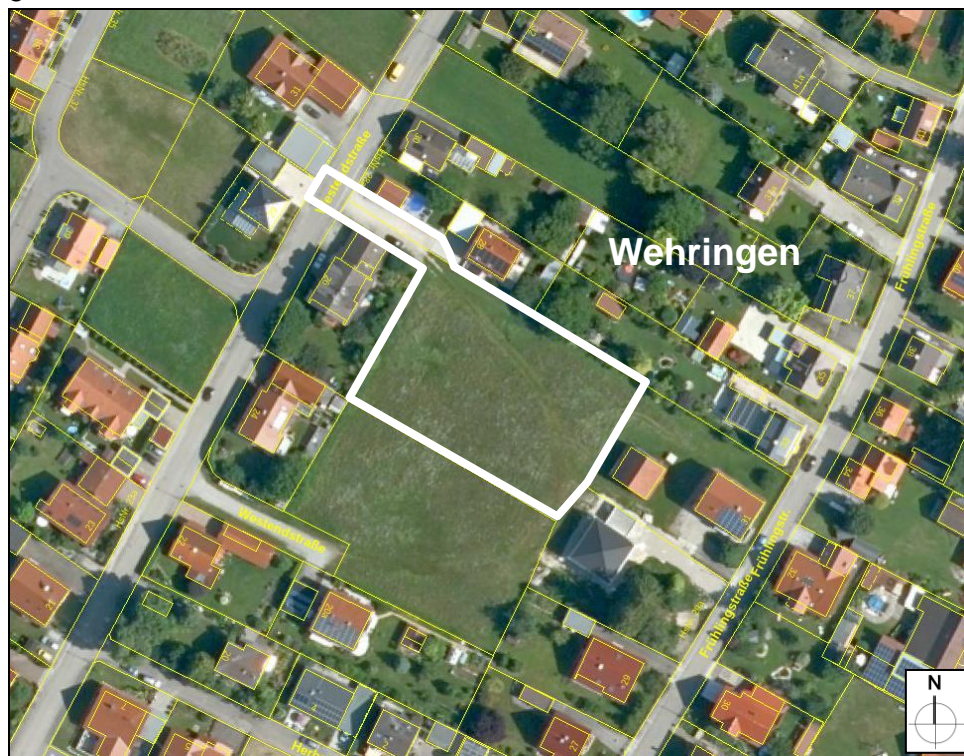
Luftbild Lage Plangebiet

Das Plangebiet des Bebauungsplanes Nr. 26 „Betreutes Wohnen, Westendstraße“ befindet sich im westlichen Teil der Ortslage Wehringen, östlich der Westendstraße (tlw. einschließlich). Es umfasst die Grundstücke Flur Nrn. 333/12, 334/4 (tlw.) und 600/1 (tlw.), jeweils Gemarkung Wehringen.